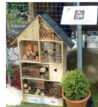
Hôtel à insectes